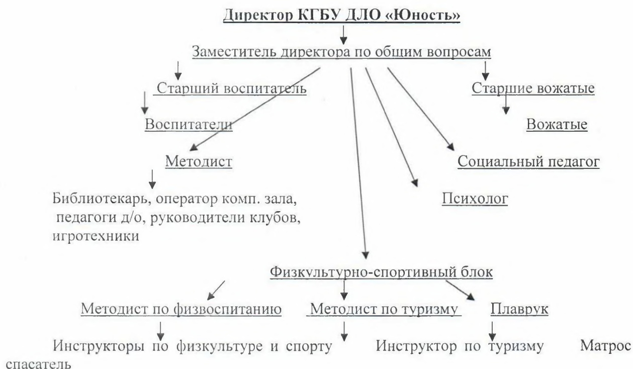
Схема кадрового обеспечения КГБУ ДЛО «Юность» (хозяйственная служба)