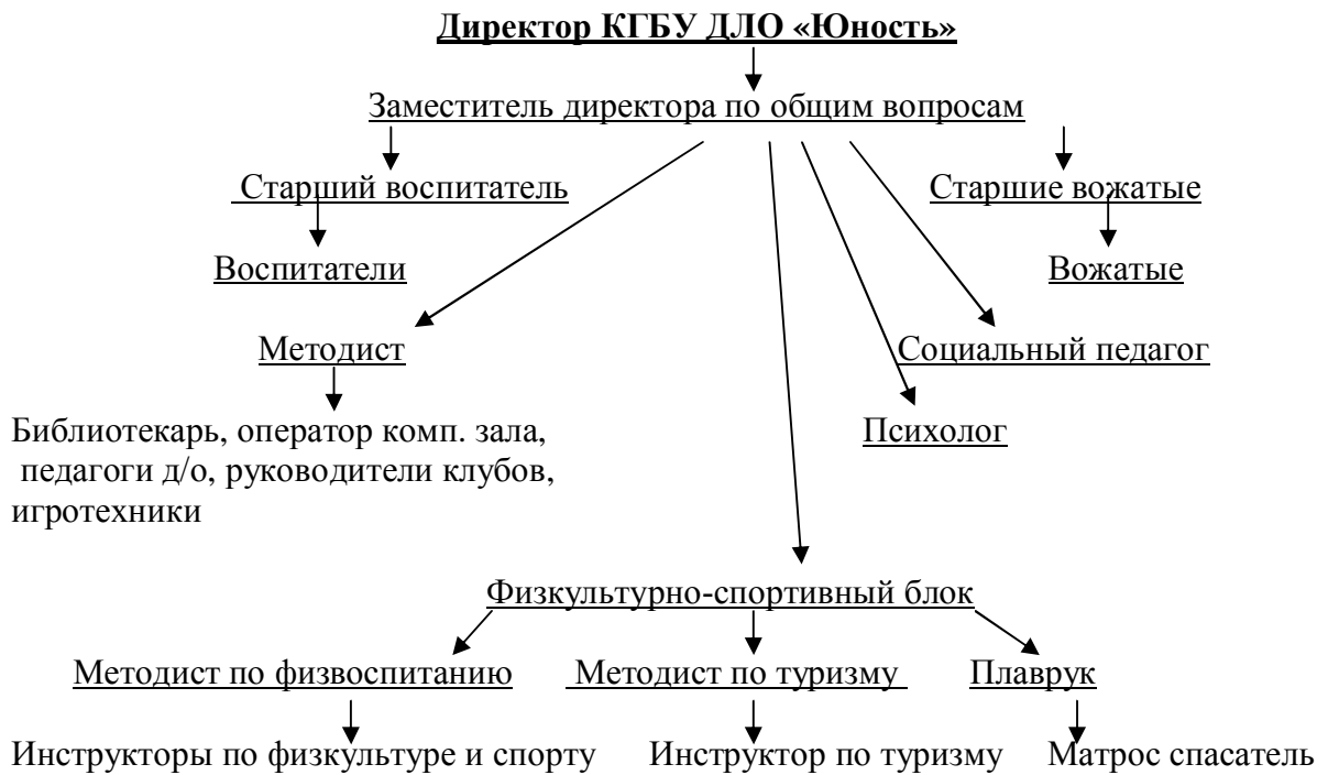
Схема кадрового обеспечения КГБУ ДЛО «Юность» (хозяйственная служба)